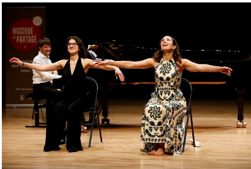
Master-classe de Nadine Sierra

Le CIC et le Festival de Pâques vous donnent rendez-vous le 7 octobre 2026 pour découvrir l' édition 2027 qui se déroulera du 20 mars au 4 avril à Aix-en-Provence.