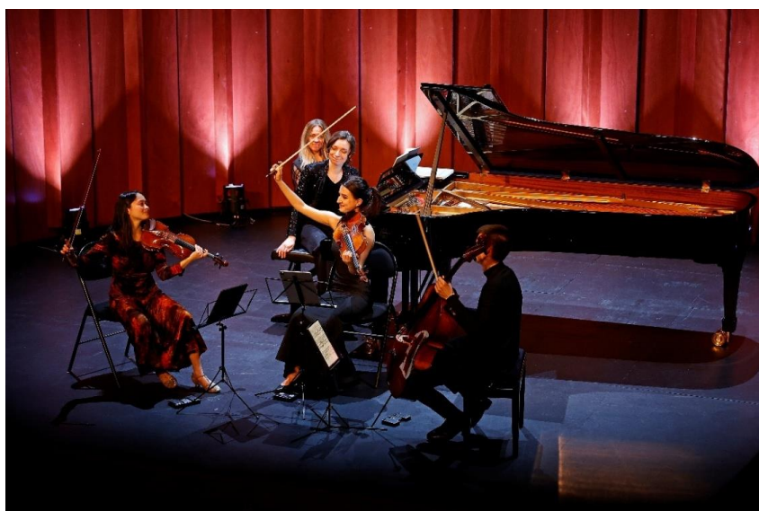
Concert Génération@ Aix