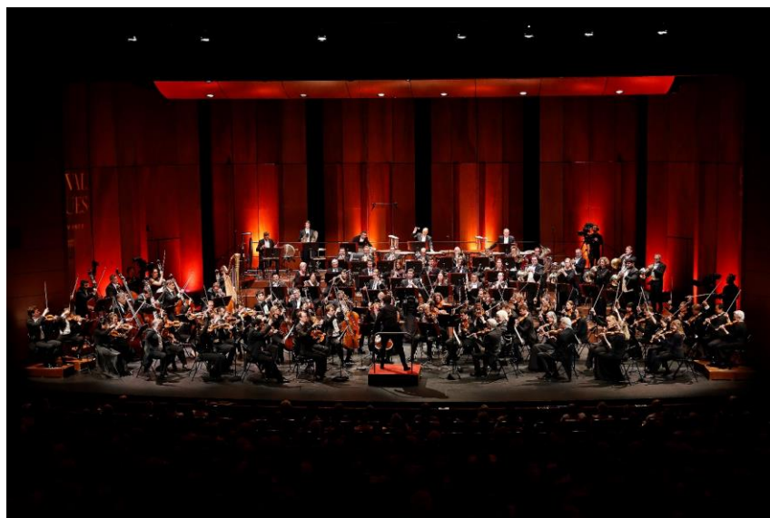
Orchestre Philharmonique de Munich et Lahav Shani en résidence pendant 3 ans

Pour Dominique Bluzet et Renaud Capuçon : « Cette édition 2026 a été pensée comme un espace de rencontres : entre les artistes, les générations, les répertoires. La musique y circule librement, elle se transmet, elle se réinvente, et c'est dans ce mouvement que naît l'émotion. »