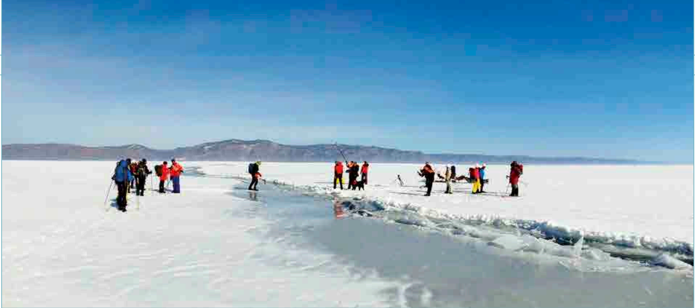
Traversée du Baïkal.