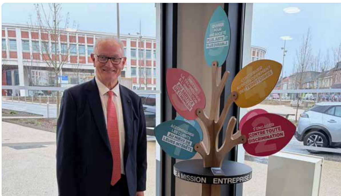
Arbre à mission dans la Caisse de Crédit Mutuel de Bruay-La-Buissière

Pour embarquer l'ensemble de ses parties prenantes, Crédit Mutuel Alliance Fédérale a multiplié les communications : newsletters, communiqués de presse... À l'occasion du CESE, le « Magazine du Dividende sociétal », réalisé en partenariat avec le Nouvel Obs et Le Monde, a été imprimé à 274 000 exemplaires et diffusé dans toutes les caisses de Crédit Mutuel, les agences CIC du groupe et aux abonnés.